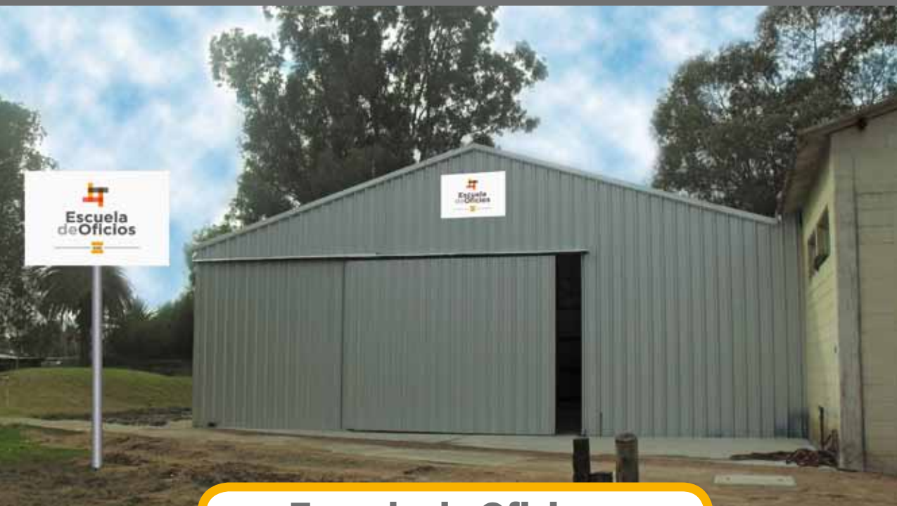
Escuela de Oficios Parque Logístico, Manga